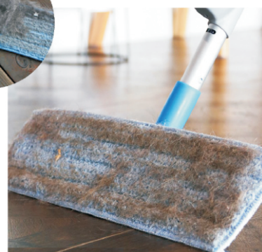
乾拖可有效除塵及毛髮