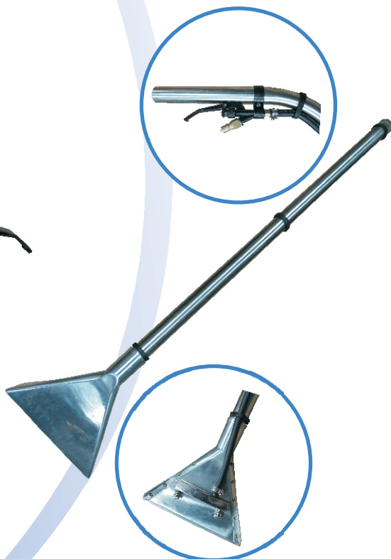
噴吸回收地鐵扒組