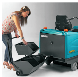
後置式大容量垃圾桶 全鋼烤漆、堅固耐用 (分離是垃圾桶-選購)