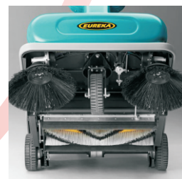
浮動式主刷設計 自動調整落差壓力，清掃效果佳