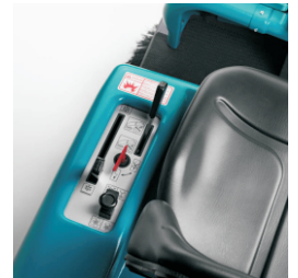
極佳的操控能見度及符合人體工學的簡易操作方式