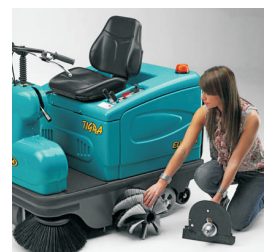
快速更換主刷設計