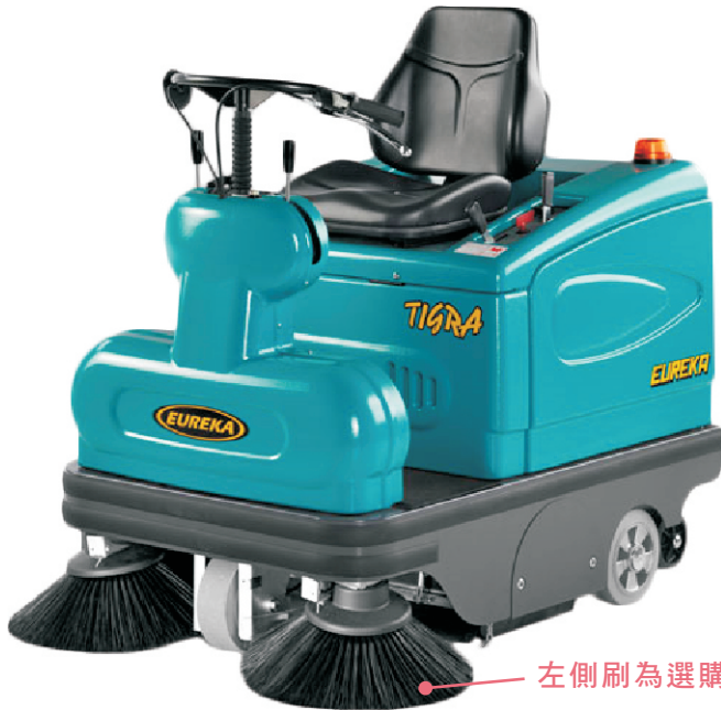
左側刷為選購配件

義大利原裝進口駕駛型電瓶式掃地機 TIGRA 是一台大面積、高清掃效率的駕駛型掃地機，絕佳的操控性及安全性，配有指示燈及倒車信號聲，簡易的維修更換方式，使用年限長，適合多種區域及地面使用。