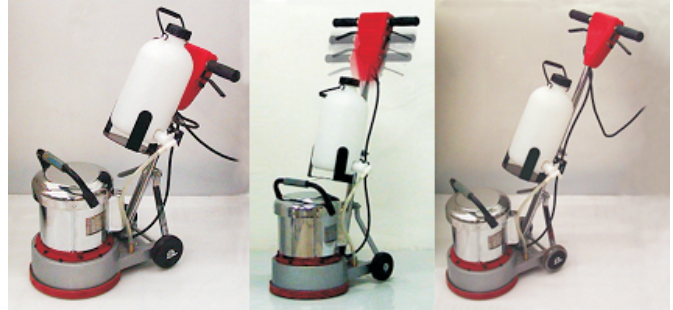
操作桿具有伸縮功能可研磨、洗地、打腊