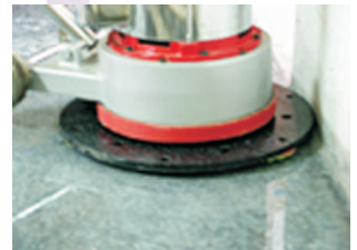
可搭配大勾盤作邊緣整修