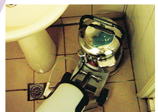
適用樓梯、狹窄空間使用